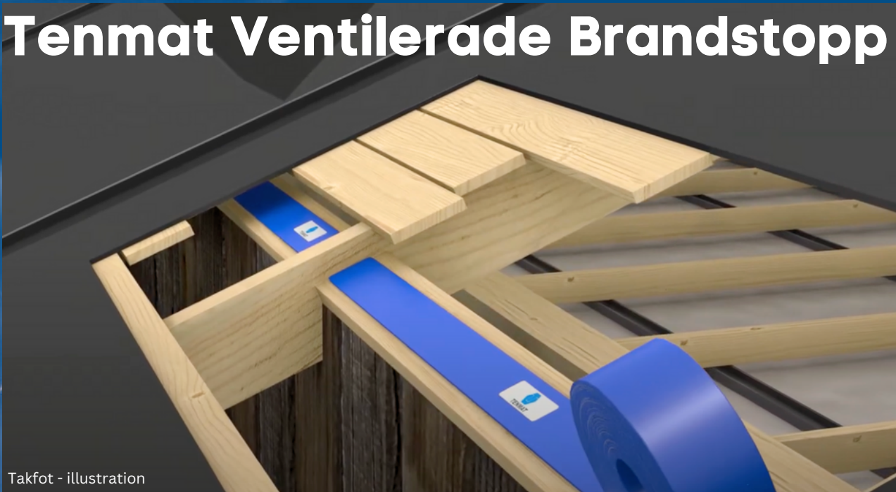
Takfot - illustration